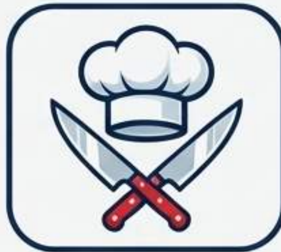
سرآشپزها، آشپزهای صنعتی و نانوایان