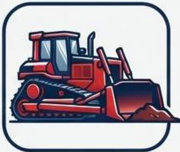
اپراتورهای تجهیزات سنگین