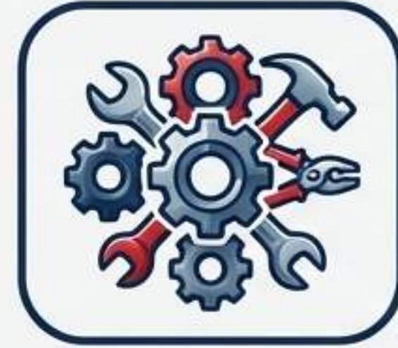
مکانیک‌ها و فلزکاران