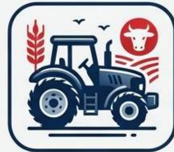
قصابان صنعتی و مدیران باغبانی/کشاورزی