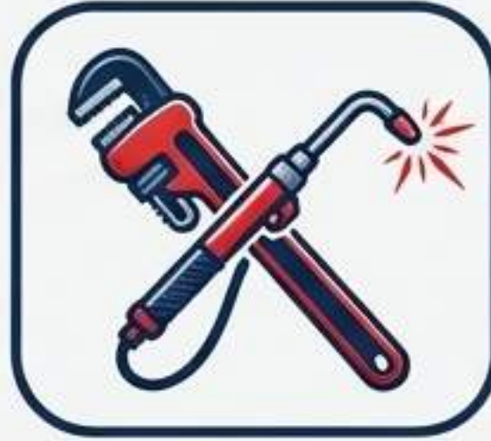
لوله‌کش‌ها و جوشکاران