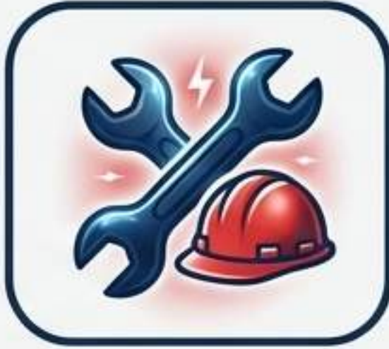
تکنسین‌های برق و ساختمان

این برنامه مختص مشاغل فنی (Trades) در سطح مهارت TEER و 3 (گروه‌های NOC شماره ۷، ۸، ۹ و بخش‌هایی از ۶) است.